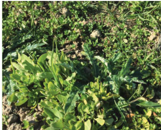
شکل ۱۲- ظهور علف های هرز باریک برگ و پهن برگ در مراحل اولیه رشد کینوا

مهم ترین علف های هرز مزارع کینوا سلمک Chenopodium album و تاج خروس Amaranthus retriflexus است. که به دلیل نزدیکی زیاد با گیاه کینوا کنترل آن در مزرعه مشکل بوده و تا کنون هیچ علف کش اختصاصی برای کنترل آن شناخته نشده است. از دیگر علفهای هرز میتوان به علف جارو Kochia scoparia ، تاجریزی سیاه Solanum nigru ، و خرفه Portulaca oleracea ، قیاق، اویارسلام، سوروف، پنیرک، کنجد وحشی و غیره نام برد