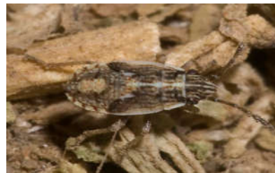
شکل ۹- پوره (سمت راست) و حشره کامل (سمت چپ) سنک بذر خوار