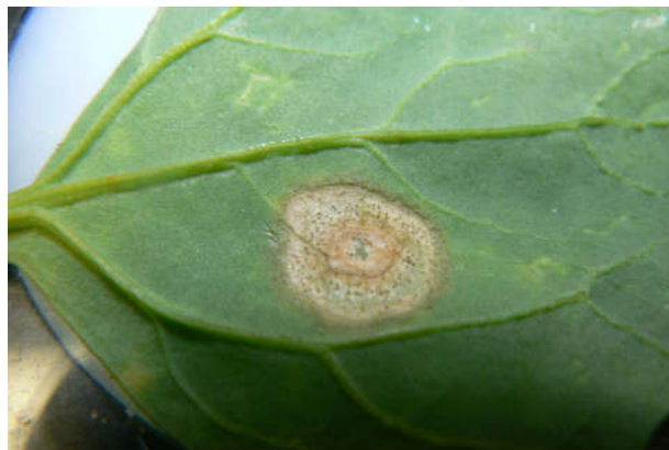
شکل ۳- علائم بیماری لکه برگ ناشی از Ascochyta hyalospora

لکه برگ کینوا با عامل Ascochyta hyalospora یک بیماری بذر زاد بوده و علائم اولیه آن روی برگها، ایجاد لکه های گرد روشن ( ۱ - ۰.۵ سانتی متر) با حاشیه قهوه ای روشن است. این لکه ها نکروزه شده و با پیشرفت بیماری، پیکنیدهای سیاه عامل بیماری، با چشم غیر مسلح قابل مشاهده می شوند. در نهایت برگ ها خشکیده و زودتر از موعد ریزش می کنند. رطوبت زیاد (بالای ۸۰٪)، درجه حرارت بالا ( ۲۵ - ۲۰ درجه سانتی گراد) منجر به توسعه و پیشرفت بیماری می شود. توزیع جغرافیایی و اهمیت اقتصادی بیماری هنوز مشخص نشده است.