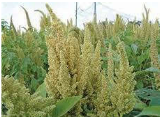
شکل ۱- گیاه کینوا

از برگ های جوان آن به عنوان سبزی تازه و یا پخته استفاده می شود. این گیاه، بومی کوه های آند در بولیوی، شیلی و پرو است که طی ۵۰۰۰ سال به طور مداوم مورد تغذیه مردم این مناطق بوده است. دانه کینوا یک شبه غله با ارزش غذایی بالاست که کم حجم و بسیار خوش هضم بوده و منبعی غنی از پروتئین، آهن، منیزیم و فیبر است. در کشورهای آمریکای جنوبی به خاویار سبز معروف است. بوته کینوا بسته به رقم و محیط ممکن است تک ساقه یا دارای انشعابات باشد. گل آذین به صورت سنبله، به رنگ های متنوع از سفید، صورتی تا قرمز تیره و ارغوانی است. این گیاه معمولاً خودگشن است ولی ۱۵-۱۰٪ دگر گشتی نیز در آن گزارش شده است. دانه کینوا دارای رنگ های متنوع مانند سفید، کرم، زرد، نارنجی، قهوه ای، بنفش، ارغوانی و سیاه است و برای جوانه زدن به آب و هوای خنک نیاز دارد که در شرایط مناسب و با تأمین رطوبت در طی ۲۴ ساعت جوانه می زند. پروتئین کینوا از نظر کمی و کیفی بهتر از دانه غلات متداول بوده و تعادل اسید آمینه ای مطلوب تری برای تغذیه انسان و دام نسبت به گندم دارد. لیزین بالا (۶.۴ - ۵.۱ درصد) از مشخصه های بذر کینوا و دو برابر گندم است. تغییر آب و هوای ایران به سمت گرم و خشک و شور شدن تدریجی خاک های زراعی کشور از یک سو و تحمل بالای گیاه کینوا در مقابل خشکی و شوری از سوی دیگر، بیانگر منطقی برای استفاده از کینوا به عنوان یک گیاه مناسب برای رسیدن به کشاورزی پایدار، تغذیه مناسب و تولید صنعتی است. توصیه فائو کشت کینوا در اراضی فقیر و با حاصلخیزی کم است. کینوا در تناوب زراعی با غلات به منظور کنترل علفهای هرز و بیماری ها نیز قابل توصیه است.