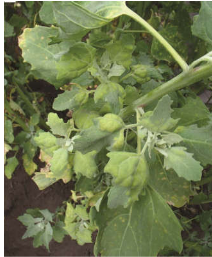
شکل ۲- علائم سفیدک داخلی روی برگ های کینوا