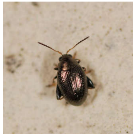
شکل ۶- حشره کامل کک چغندر قند (سمت راست) و خسارت حشره کامل روی بوته های کینوا (سمت چپ)