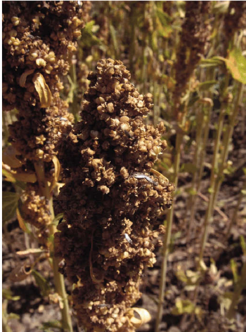
شکل ۱۰- خسارت حشره کامل سنک بر روی پانیکول کینوا در مرحله شیری شدن