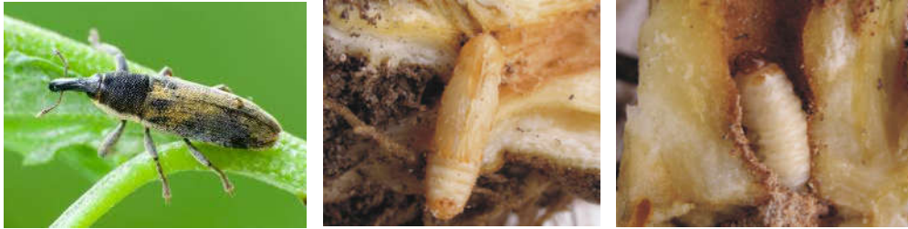
شکل ۱۱- لارو (سمت چپ)، شفیره (وسط) و حشره کامل (سمت چپ) خرطوم بلند چغندر قند

تخم: تخم‌ها بیضی شکل و به رنگ سفید مایل به زرد دیده می‌شوند. لارو: لاروها کمی خمیده، سفید رنگ و با سر قهوه ای مشاهده می‌شوند. شفیره: شفیره‌ها سفید رنگ تا کمی متمایل به زرد بوده و درون دمبرگ تشکیل می‌شوند. حشره کامل: طول حشرات کامل خرطوم بلند در حدود ۸ الی ۹ میلی‌متر بوده و دارای بدنی تیره (سیاه رنگ) که روی آن را کرک‌های زرد رنگ پوشانده است، می‌باشند. خرطوم نسبت به بدن، بلندتر و کمی خمیده است.