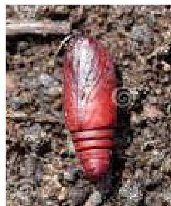
شکل ۷- تخم (بالا سمت راست)، لارو (بالا سمت چپ)، شفیره (پایین سمت راست) و حشره کامل (پایین سمت چپ) اگروتیس