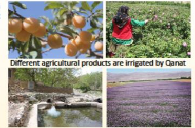
Different agricultural products are irrigated by Qanat