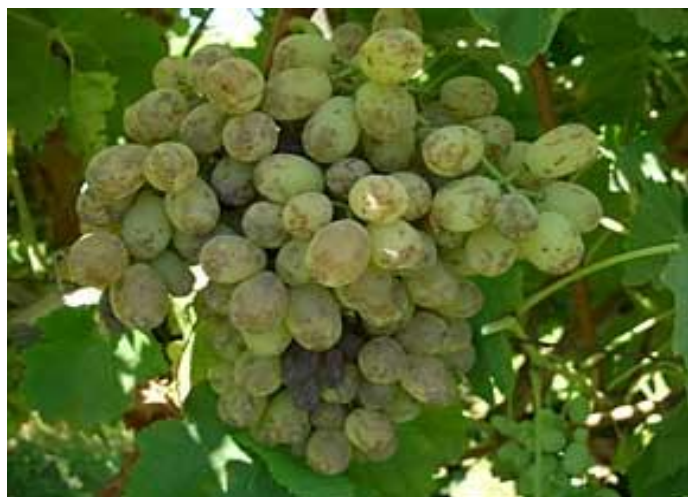
شکل ۴- علائم بیماری اسکا بر روی حبه های انگور به صورت نقاط سیاه رنگ (خال سیاه).